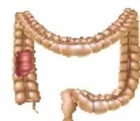
Τα στάδια του καρκίνου του παχέος εντέρου