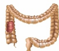
Τα στάδια του καρκίνου του παχέος εντέρου